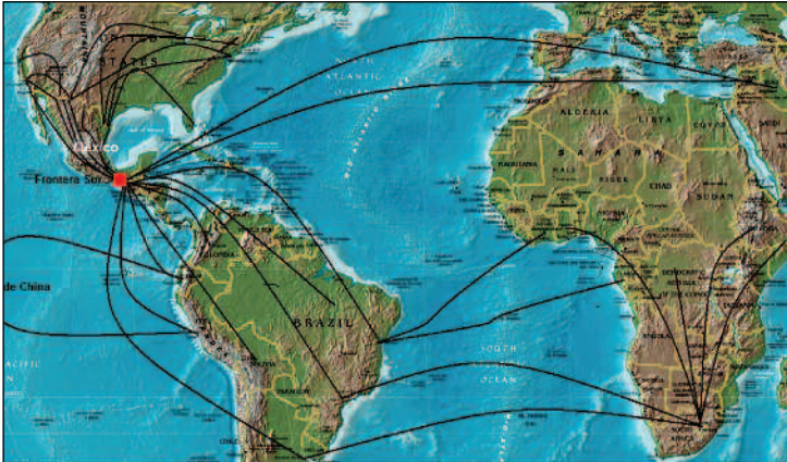
Mapa 2 Rutas migratorias de indocumentados que cruzan la frontera sur chiapaneca