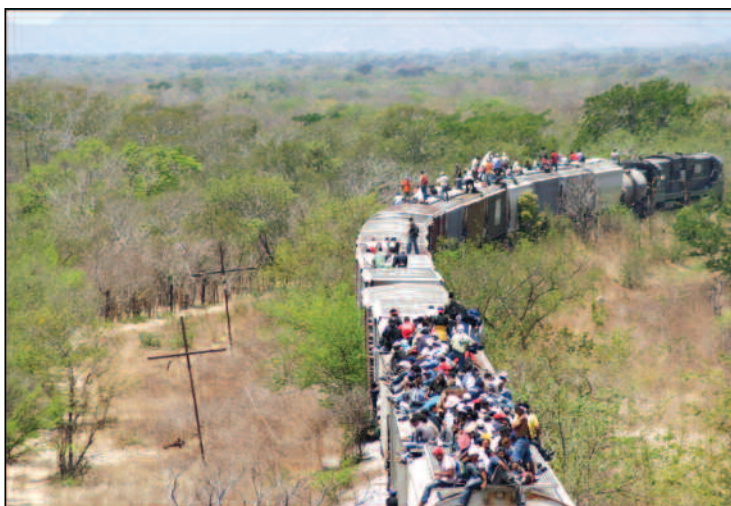
Arriaga, Chiapas.