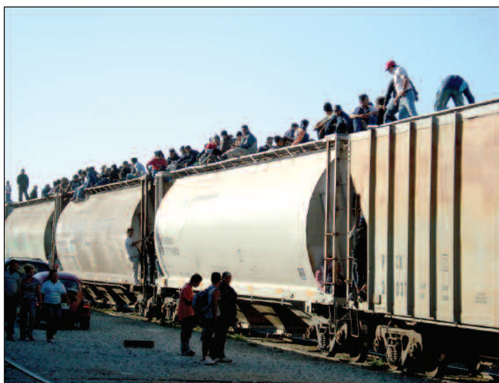
Foto: cortesía Casa de Migrantes Albergue de la Misericordia. Arriaga, Chiapas.

Históricamente, Estados Unidos ha sido uno de los principales destinos de la migración andina. Sin embargo, muy poco se conoce sobre las diversas estrategias que ecuatorianos, peruanos, bolivianos o colombianos despliegan para sortear controles fronterizos estatales y, sobre todo, para hacer frente a la inmensa violencia que supone transitar de manera indocumentada y por rutas ocultas hasta la potencia del norte. En un contexto más amplio, a pesar de que la migración indocumentada de sur a norte constituye una de las más voluminosas a nivel mundial, su carácter clandestino y fugaz parecería haber limitado la investigación y por ende la visibilización de las estremecedoras experiencias por las que atraviesan los “sin papeles”. Esta invisibilización –quizá estratégica– ha influido a su vez en que los Estados de origen, tránsito y destino mantengan vigente la aplicación de políticas migratorias que se concentran únicamente en el control y seguridad fronteriza y dejan de lado el respeto de los derechos de los migrantes indocumentados en tránsito.