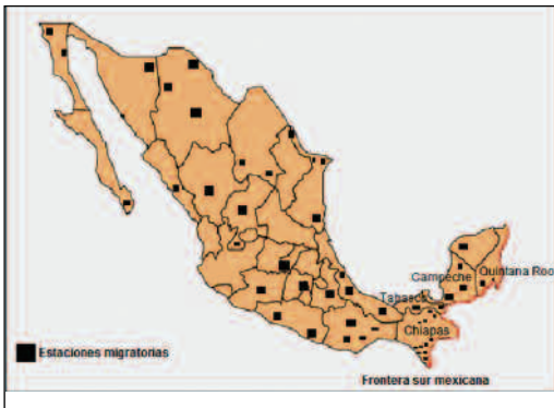
Mapa 1 Estaciones migratorias en México