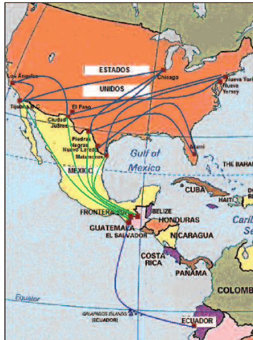
Mapa 3. Rutas migratorias de indocumentados ecuatorianos y centroamericanos