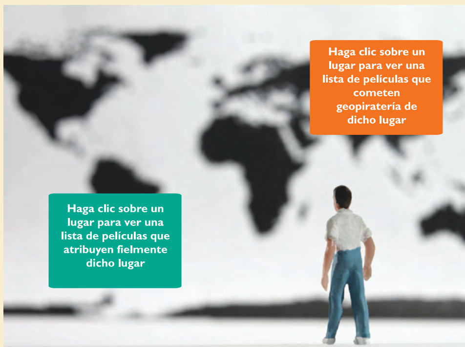
FIGURA 2. MAPA INTERACTIVO DE GEOPIRATERÍA USADO CLIP ART DE MICROSOFT

Nota: Las bases de datos en formatos de wiki pueden invitar a visitantes para clasificar las películas en relación con los cuatro tipos de geopiratería. Puesto que cada película puede cometer múltiples tipos de geopiratería y atribución fiel, los datos deben incluir el lapso de la falsa atribución desde el comienzo de la toma de título (por ejemplo, 1h08:45, es decir, una hora ocho minutos y cuarenta y cinco segundos desde el comienzo de la toma de título).