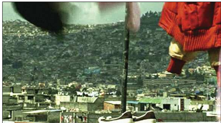
Fotograma del documental

Armados de pequeños capitales, y gracias al apoyo crediticio estatal, imaginan formas de salir adelante independientemente. Hay unos que son más exitosos que otros, hay quienes han sufrido frente a la delincuencia la pérdida parcial de sus inversiones, hay quienes han buscado maneras innovadoras de atraer clientela, hay quienes han importado tecnología para revolucionar, por ejemplo, la industria de la construcción. Pero lo laboral es solamente una de las dimensiones que constituye la experiencia del retorno. La satisfacción de las necesidades