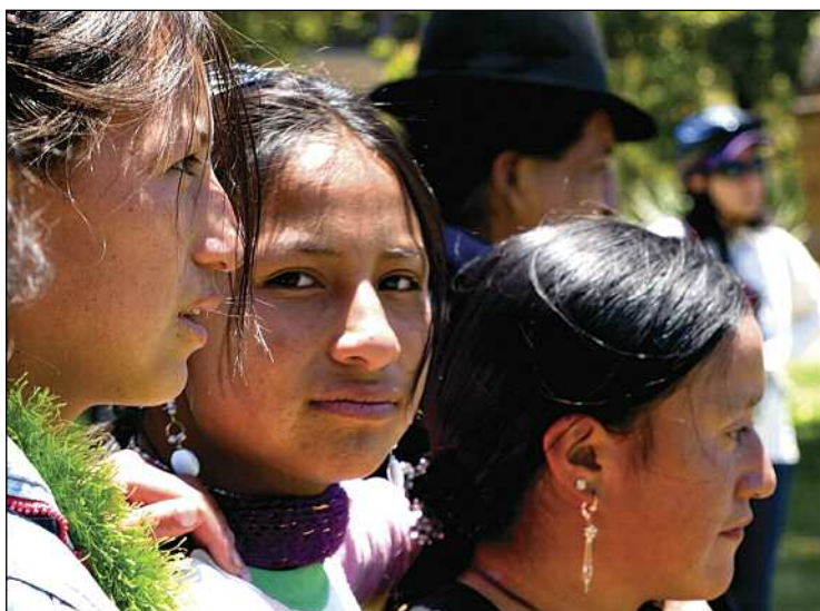
Save the Children

Entre las políticas que emprenden los Estados para vincularse a sus diásporas, se distinguen dos grandes grupos. Por un lado, están aquellas que buscan contribuir al asentamiento exitoso de los migrantes en sus diferentes destinos e incentivan el fortalecimiento de los vínculos de esa población con su país de origen. Estas políticas han sido denominadas por los distintos autores como políticas diaspóricas (Smith, 1999), políticas de vinculación (Mármora, 2002) o políticas de extensión (Goldring, 1999). Por otro lado, están aquellas destinadas a favorecer y facilitar el retorno de los migrantes, las llamadas políticas de circulación y repatriación (Smith, 1999), políticas de retorno (Mármora, 2002) o políticas de intromisión (Goldring, 1999) 1 .