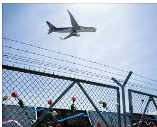
Save the Children

La presente edición del boletín AndinaMigrante se centra en el tema de las políticas de retorno, y su aplicación en Latinoamérica. En el dossier central presentamos un análisis comparativo entre las políticas de retorno implementadas por los principales países de destino de la migración internacional latinoamericana y por los países de la región que actualmente aplican este tipo de políticas. El análisis toma como marco la aprobación de la Directiva de Retorno y la actual crisis financiera global.